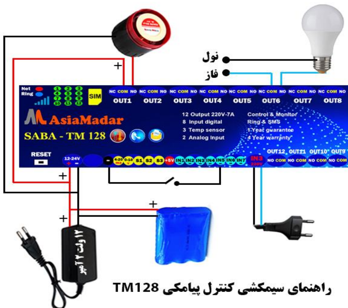
راهنمای سیمکشی کنترل پیامکی TM128

با ارسال دستور *INF6# گزارش مربوط به وضعیت سنسور های دستگاه برای فرستنده پیام ارسال می شود .